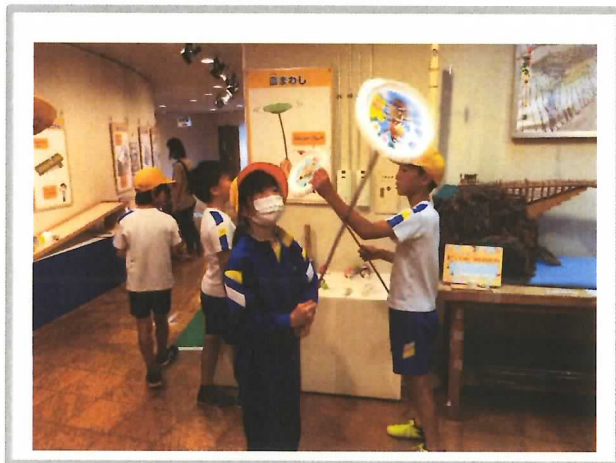
4年生 校外学習(吉田科学館)